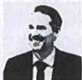
Professeur Grégoire Borst

Apprendre - c'est contrôler ses pensées, ses émotions, son impulsivité. Des pistes pour les personnes concernées par les Troubles du Neuro-Développement ?